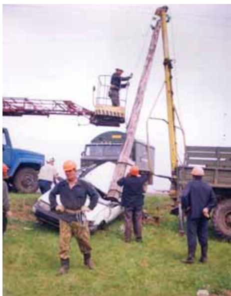
▲ А деревянная опора сильней железного мотора