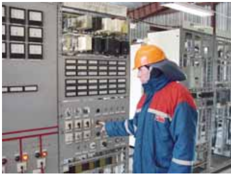
▲ Я на кнопку нажму и такое покажу....