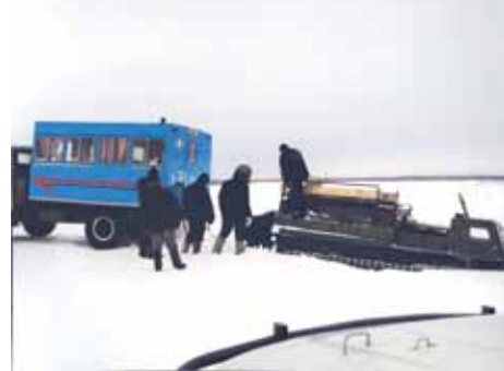
▲ Ох, нелегкая это работа - из сугроба тащить вездехода....