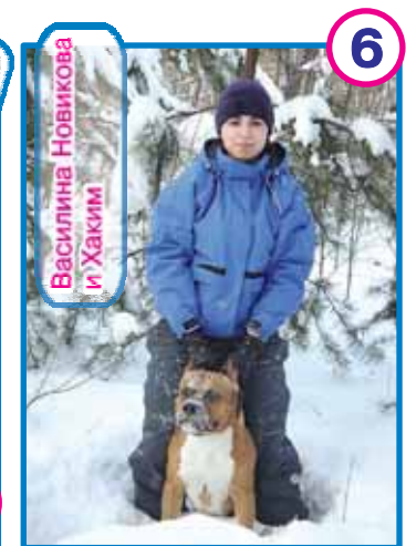
▲ «Горяч внутри и снаружи, не боюсь я зимней стужи»

Редколлегия: Главный редактор Елена Евстафьева 223-34-88, 229-85-22, 42-56, eev@nske.ru Пресс-служба "Новосибирскэнерго": Татьяна Троицкая, Анастасия Яцентюк 229-85-22, 45-22, press2@nske.ru , press@nske.ru Технический редактор Сергей Саночкин 223-34-88, 47-22, ssz@nske.ru ЗАО "РЭС" Александр Уразов 20-111-20 Топливо Светлана Краля 349-97-04 Генерация Алексей Ковалев 268-04-09, 268-15-20 (факс) ЗАО "Новосибирскэнерго" Татьяна Лучина 349-94-37 ЗАО "Новосибирскэнергообит" Мария Кравцова 229-89-66 ОАО "Новосибирскгортеплоэнерго" Роман Корниенко 223-05-59, 223-15-61, 223-82-71 (факс) ЗАО "НРДЦ" Марина Сулова 229-15-03, 33-03 ЗАО "ПРП" Александр Крылов 349-98-55