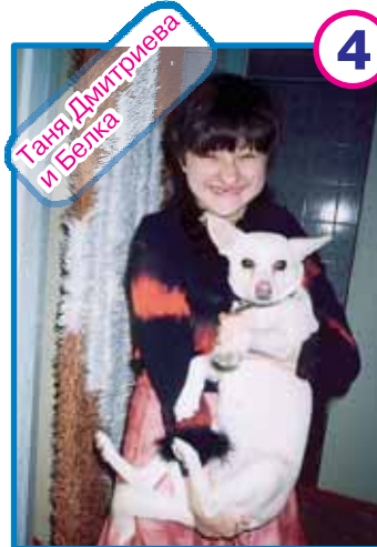
▲ «Блондинам всегда нравились брюнетки»

Присылайте новые фотографии по электронной почте press@nske.ru или приносите в пресс-службу по адресу ул. Свердлова, 7, к. 202 до октября 2006г. Торопитесь! Желающих принять участие становится все больше, конкуренция все жестче! Все участники конкурса получают симпатичные призы.