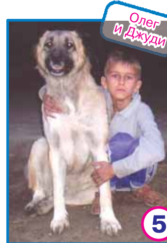
▲ «Сказали, будет птичка. Ну, и где ж она?»